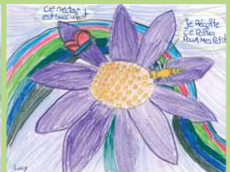
Lucy, classe de 4 e , Péry