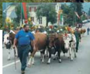
Prochaines désalpes Lignières, le 24 septembre 2006 Villeret, les 29 et 30 septembre 2006

Les agriculteurs prennent des initiatives: la reconnaissance des Appellations d'Origine Contrôlées (AOC) pour la Tête de Moine et le Gruyère d'alpage par exemple permettent de limiter la chute du prix du lait. Quelquefois, l'exploitation laitière cède la place à l'élevage de vaches pour la production de viande.