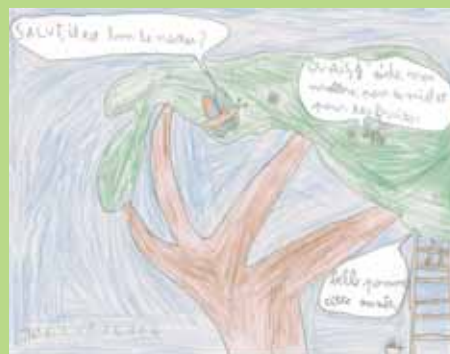
Joel, classe de 4 e , Péry