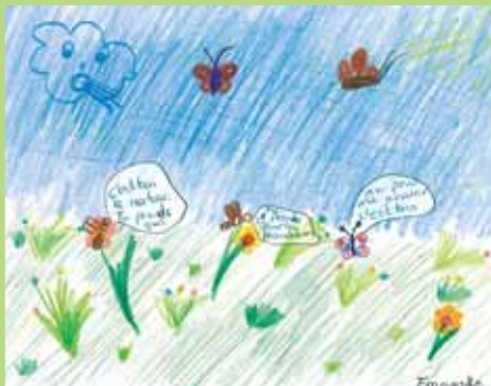
Franziska classe de 4 e , Péry