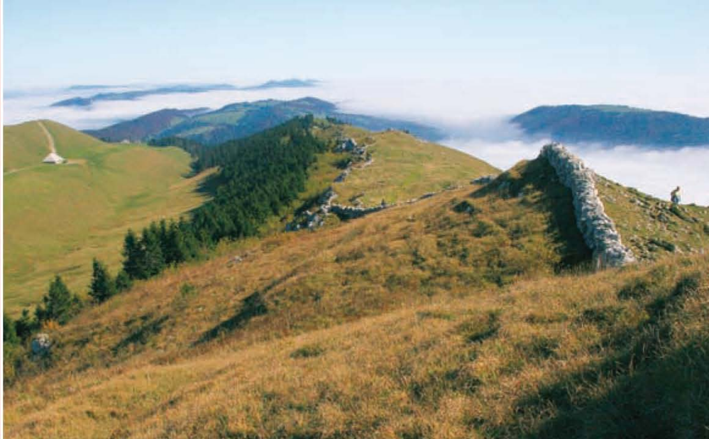
▲ Crête de Chasseral et mur en pierres sèches.

Suivez à pied les chemins parcourus depuis quatre siècles par les anabaptistes, une communauté venue se réfugier sur les hauteurs du Jura. Découvrez les hauts lieux historiques de cette épopée au milieu des paysages uniques du Parc régional Chasseral.