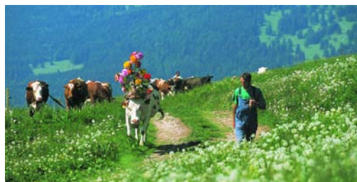
Les bouses, déchets parfaitement recyclés / Perfekt recycelter Kuhmist