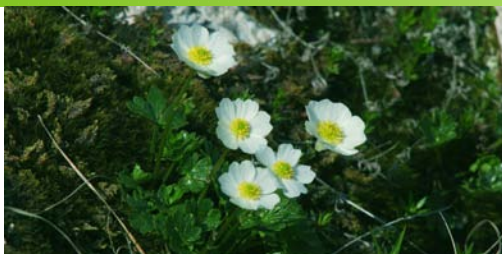
Hautes altitudes, plantes basses / Grosse Höhen, niedrige Pflanzen