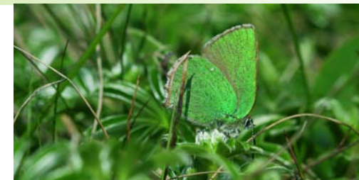
Plantes et papillons, des inséparables / Pflanze und Schmetterlinge, zwei Unzertrennliche