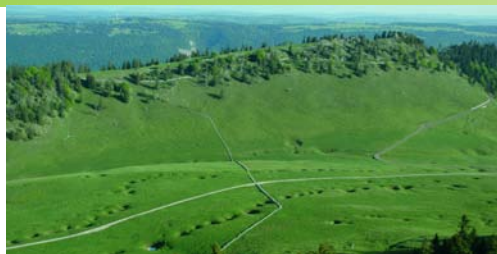
Les dolines, ouverture vers un monde souterrain / Die Dolinen, Türen zur unterirdischen Welt