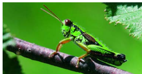
La vie de criquet, manger et être mangé / Das Leben der Feldheuschrecke: essen und gegessen werden