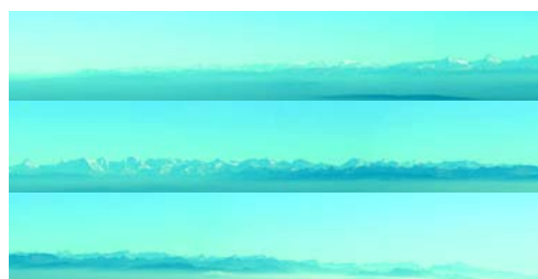
Carte postale «panorama des Alpes» / Postkarte «Alpenpanorama»

15 cartes postales/ Postkarten (format 21 x 10.5 cm)