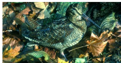
Forêt ouverte, refuge d'espèces rares / Offener Wald, Zufluchtsort für seltene Arten