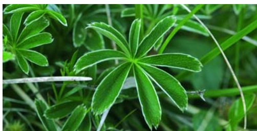
Les plantes, médecine d'antan / Heilpflanzen, die Medizin früherer Zeiten