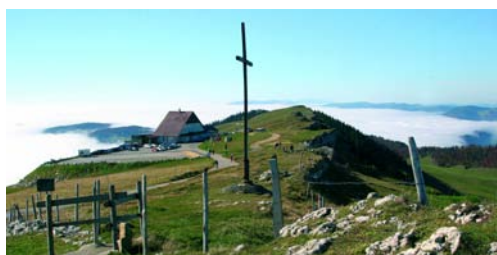
Carte postale «Hôtel Chasseral» / Postkarte «Hotel Chasseral»