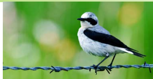
L'été au Chasseral, l'hiver en Afrique! / Im Sommer auf dem Chasseral, im Winter in Afrika!