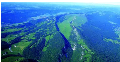
Le Chasseral, un bourrelet de roches / Der Chasseral, ein riesiges Faltengewölbe