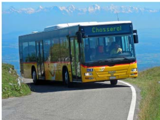
Parc régional Chasseral, rapport d'activités 2008 et projections 2009

Un groupe de travail a suivi le travail de Planair et a réfléchi aux possibilités existantes pour stimuler les initiatives sur cette question dans le Parc.